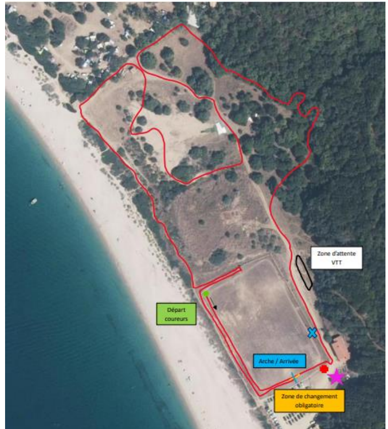
Benjamins 3 tours (4,3 km)